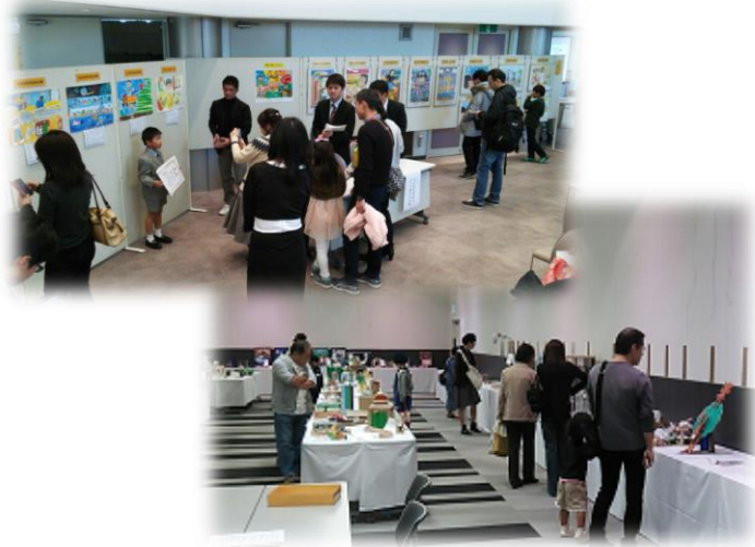
奈良県児童・生徒発明くふう展示会と絵画展の様子 ▲