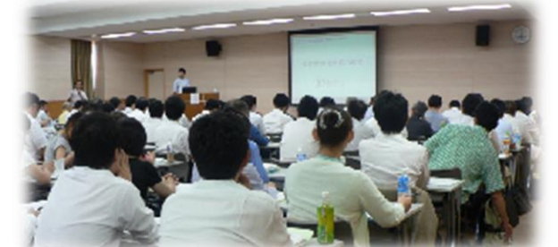
知的財産権に関する説明会 ▲